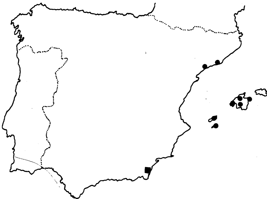
Fig. 1.— A. polyanthum Schultes & Schultes fil. Poblaciones anteriormente conocidas (●). Nueva población (■).

A. polyanthum Schultes & Schultes fil. es una especie perteneciente a la sect. Allium e íntimamente relacionada con A. ampeloprasum L., del que se distingue por su menor porte —hasta 30-40 cm—, menores inflorescencias —hasta 4,5 cm—, hojas de margen general-