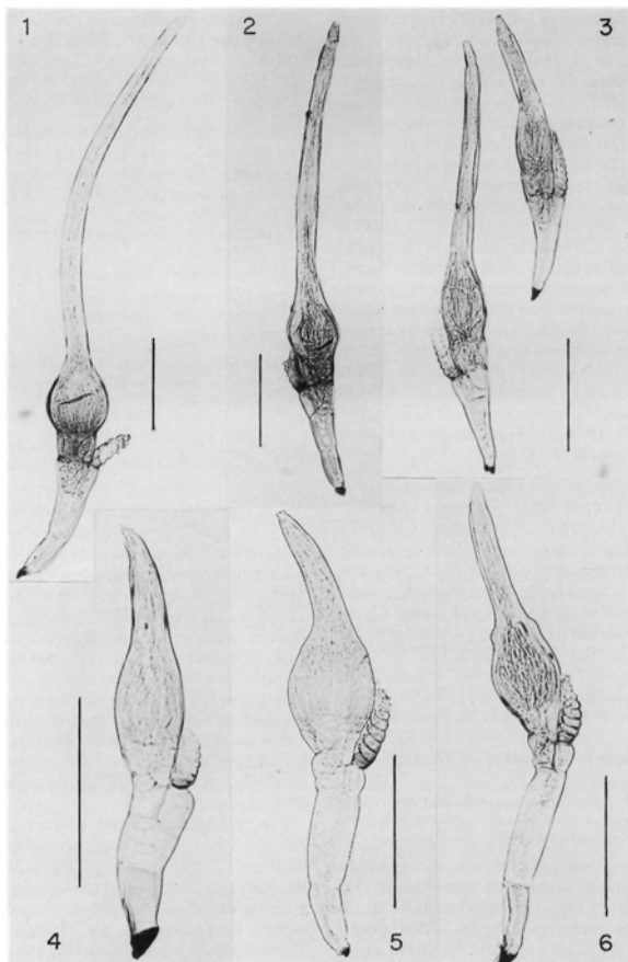
Figs. 1-4.— Stigmatomyces crassicolis (fig. 1: SS-1137b; figs. 2-3: SS-1137a; fig. 4: SS-1139). Figs. 1-2.—Ejemplares procedentes de la cabeza de Leptocera fontinalis . Fig. 3.—Ejemplares procedentes de las patas del mismo insecto hospedante. Fig. 4.—Ejemplar procedente del margen anterior de una ala de Opalimosina czernyi . Figs. 5-6.— Stigmatomyces divergatus (fig. 5: SS-1151; fig. 6: SS-1148). Fig. 5.—Ejemplar procedente de los esternitos de Spelobia parapusio . Fig. 6.—Ejemplar procedente de los terguitos de un hospedante de la misma especie anterior. (Escala: 100 \mu m.)