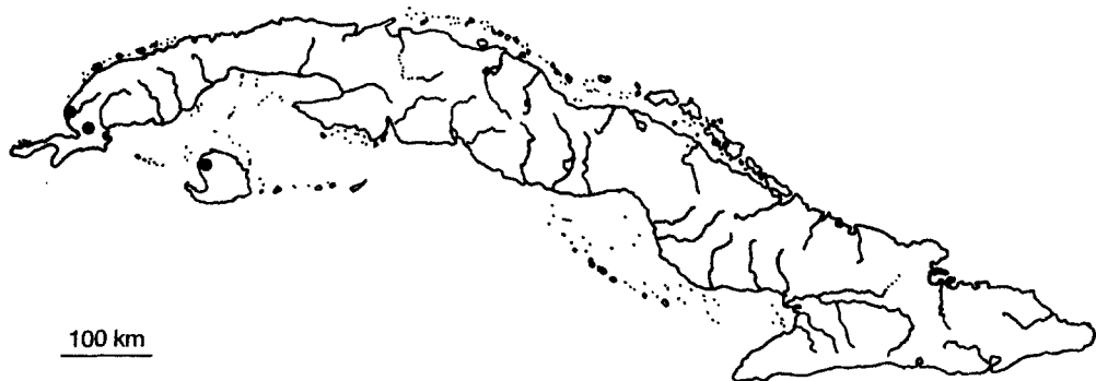
Fig. 3.—Distribución de Mayaca aubletii en Cuba.

Hierbas de lugares permanentemente húmedos o sumergidas. Tallo laxo, 10-20 cm de