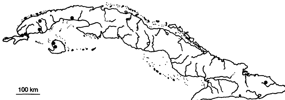
Fig. 2.—Distribución de Mayaca fluviatilis en Cuba.

yormente subterminales antes de la antesis; pedúnculo floral de 1-5 mm, más corto que las hojas, raramente mayor, subtendido por una bráctea membranosa de 1,5-2 mm de longitud; sépalos de 2,5 mm de longitud, lanceolados, verdes, persistentes; pétalos de similar longitud que los sépalos, obovados, con ápice redondeado, blancos, rosados o morados. Fruto en cápsula de 3-5 mm de longitud, oblongo-elíptica. Semillas 1,3 mm de diámetro, de pardas a negras, mayormente 8 por cápsula.