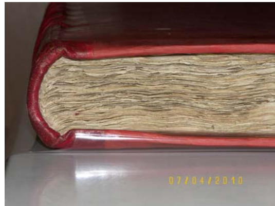
LOMO CABEZADA DESPUÉS