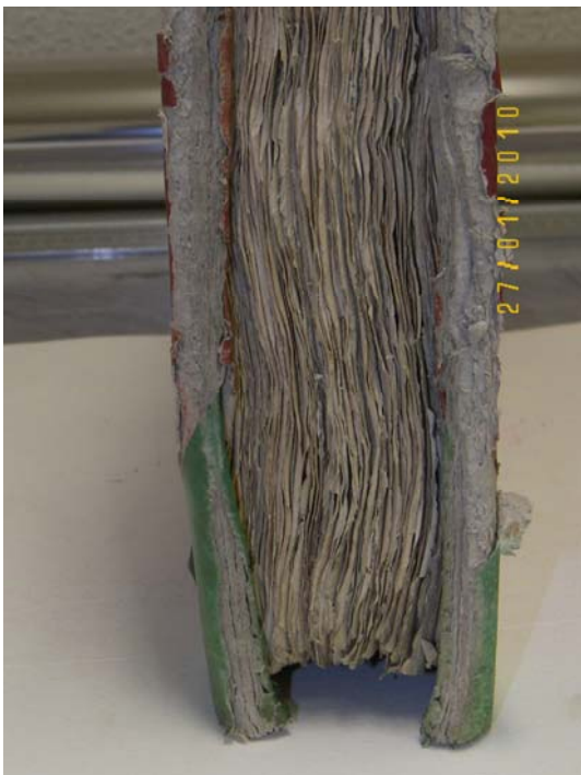
PUNTAS Y CANTOS ANTES