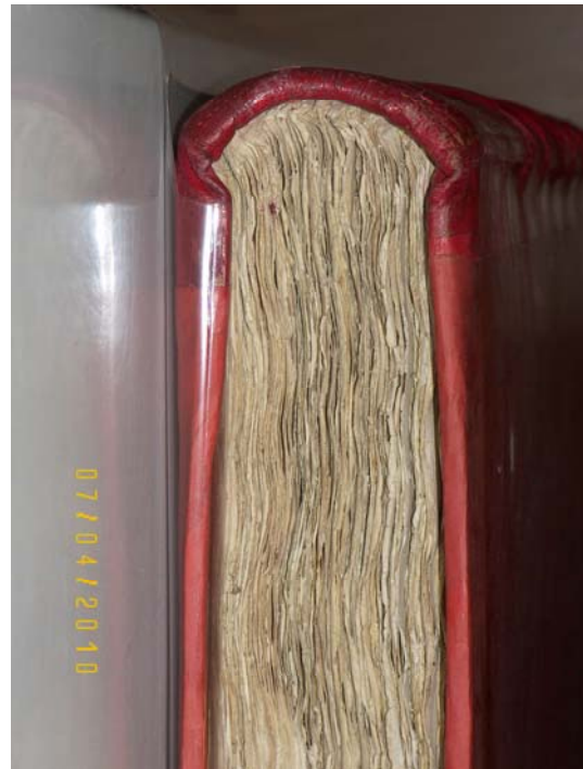
DETALLE LOMO DESP