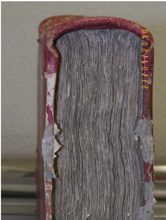
DETALLE LOMO ANTES