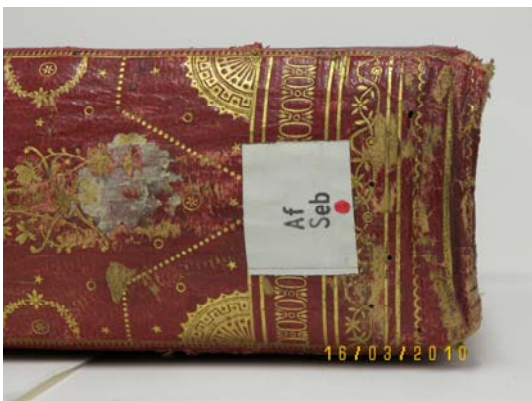
LOMO PIE ANTES