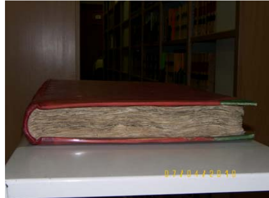
CANTOS PIE DESPUÉS