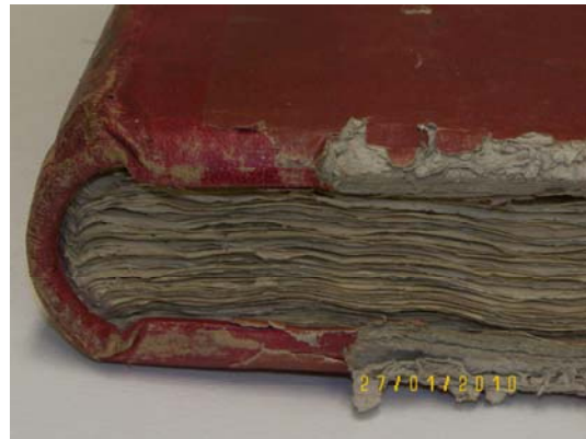
LOMO CABEZADA ANTES