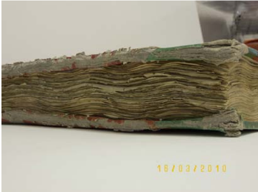
CANTOS PIE ANTES